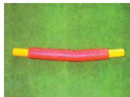
Support bar/ Barre de support