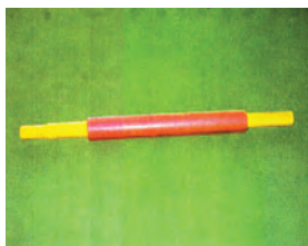
Support bar/ Barre de support